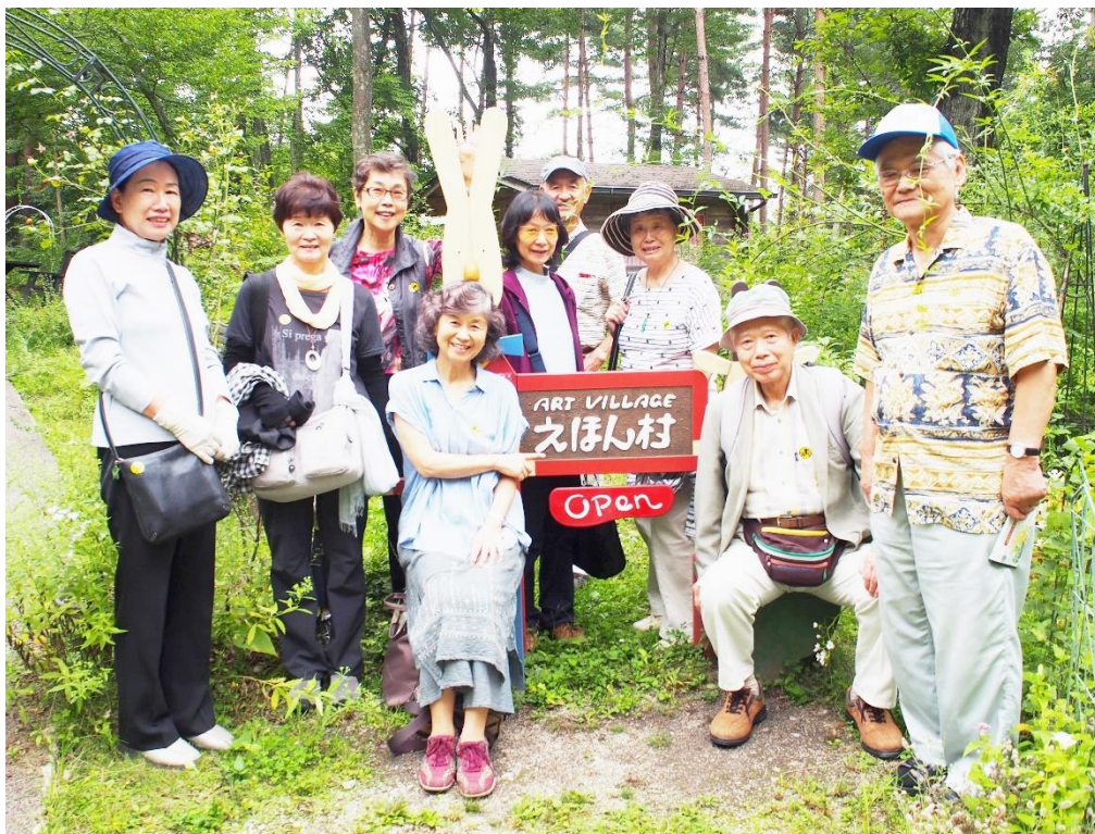
「えほん村」にて 2016.9.11 八ヶ岳合宿